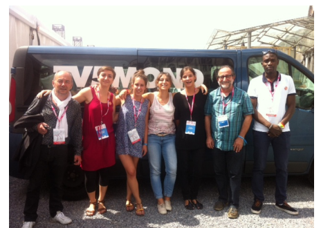
Equipe de la Caravane des dix mots