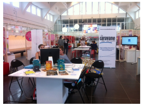
Espace Caravane des dix mots au Village de l'innovation