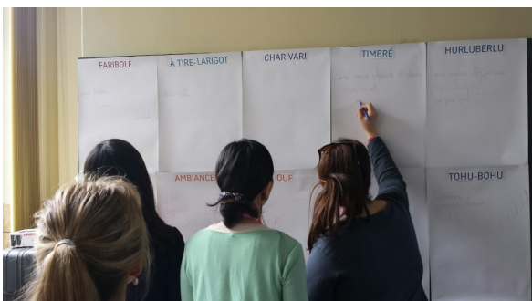
Atelier d'initiation aux outils de sensibilisation à la diversité culturelle et à la francophonie

Les films documentaires « Intimités francophones » sont une conversation entre les francophones des Amériques. Ces derniers nous racontent leurs enjeux linguistiques et leurs cultures façonnées par la pluralité des langues du territoire. À chaque instant, les identités se dévoilent, les mots se délient, les luttes se précisent. Dans le deuxième volet, Intimités francophones va à la rencontre de francophones au Canada et au Brésil.