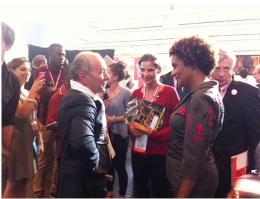
Rencontre avec Mickaëlle Jean sur l'espace Caravane des dix mots au Village de l'innovation

Le mardi 21 juillet 2015, Michaëlle Jean Secrétaire générale de l'Organisation Internationale de la Francophonie, a visité les différents espaces installés au Village de l'innovation. L'équipe de la Caravane des dix mots a ainsi pu lui présenter ses différentes activités.